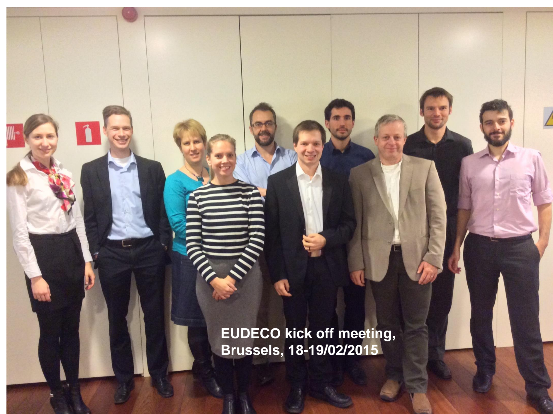
EUDECO kick off meeting, Brussels, 18-19/02/2015