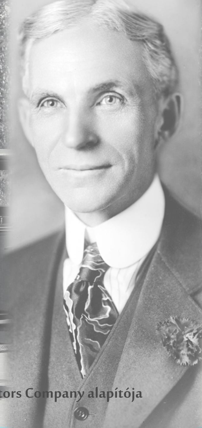
Henry Ford, Ford Motors Company alapítója