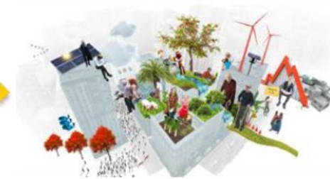
Circular Urban Economies an integrated approach for urban greening and circularity transitions