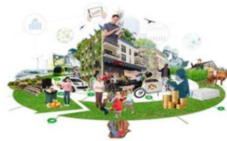
Positive Energy Districts and Neighbourhoods transforming the urban energy system

Körforgásos városi gazdaságok (Circular Urban Economies – CUE)