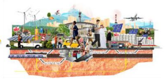
The 15 Minute Cities rethinking the urban mobility system and space